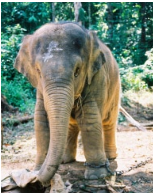
Waisenelefant im Sanctuary