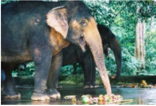
Arbeitselanten beim Fressen