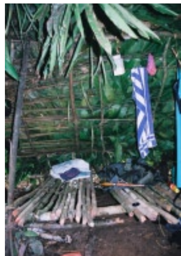
Jack gezeichnet vom Hunger