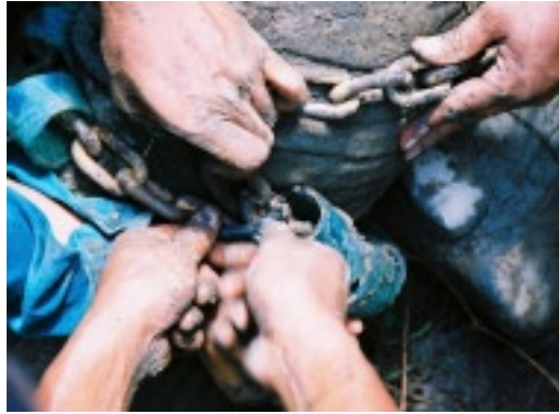
Anketten des Elefanten