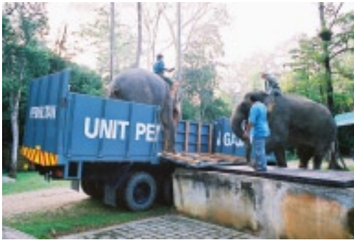
◀ Das Verladen der Arbeitselanten ▼